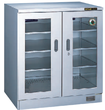
TDC-500-AHU ¥370,000 (税別・送料別)