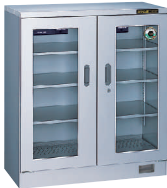
TDC-290-AHU ¥270,000 (税別・送料別)