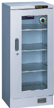
TDC-150-AHU ¥178,000 (税別・送料別)