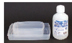
トレーセット・加湿液