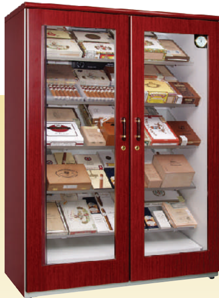
(棚板は角度調節可能です。)