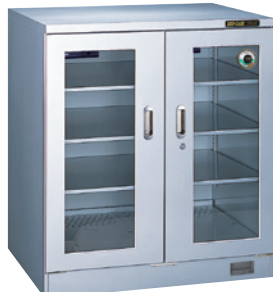
TDC-500-AHU ¥380,000 (税別・送料別途)