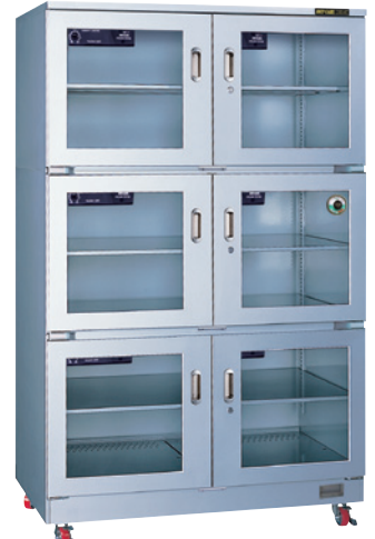
TDC-1310-AHU ¥730,000 (税別・送料別途)