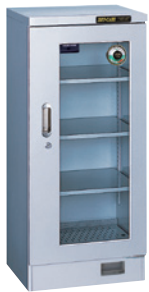
TDC-150-AHU ¥188,000 (税別・送料別途)