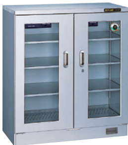
TDC-290-AHU ¥285,000 (税別・送料別途)