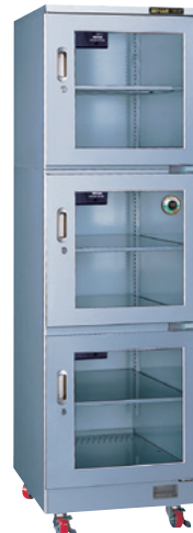
TDC-650-AHU ¥495,000 (税別・送料別途)