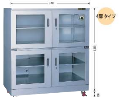
写真はデュアル湿度計付 TDC-918-QS型 (庫内奥行650mm/外寸奥行725mm) TDC-918-QA ¥590,000 TDC-919-QS ¥530,000 (税別・送料別途)