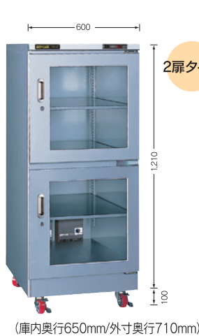
(庫内奥行650mm/外寸奥行710mm)

TDC-430-DDX ¥215,000 TDC-431-PDX ¥260,000 (税別・送料別途)