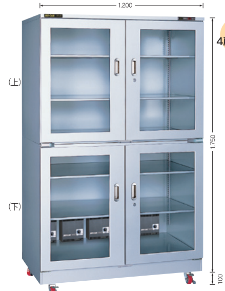
(庫内奥行650mm/外寸奥行710mm)

TDC-1310-DDX ¥360,000 TDC-1311-PDX ¥515,000 (税別・送料別途)