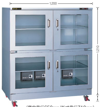
(庫内奥行650mm/外寸奥行710mm)

TDC-1410-DDX ¥355,000 TDC-1411-PDX ¥510,000 (下段のみも製作可) (税別・送料別途)