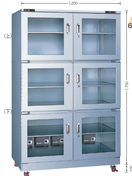
(庫内奥行650mm/外寸奥行710mm)

TDC-650-DDX ¥298,000 TDC-651-PDX ¥345,000 (税別・送料別途)