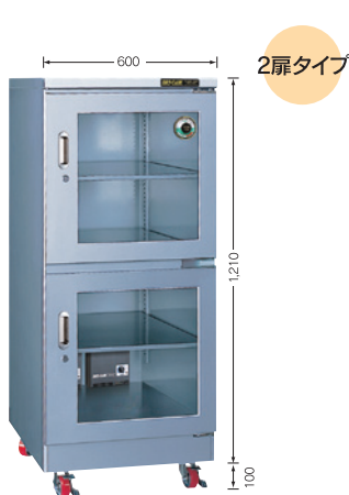
(庫内奥行650mm/外寸奥行730mm)