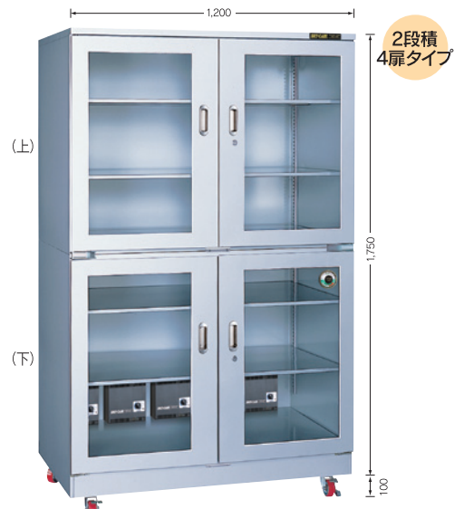
(庫内奥行650mm/外寸奥行730mm)