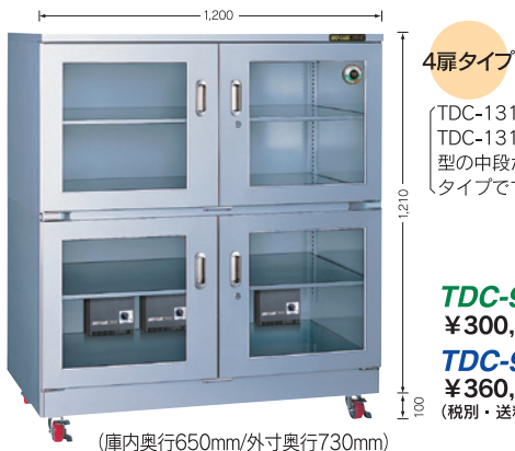
(庫内奥行650mm/外寸奥行730mm)

4扉タイプ (TDC-1310-AX) (TDC-1311-PX) 型の中段がない タイプです