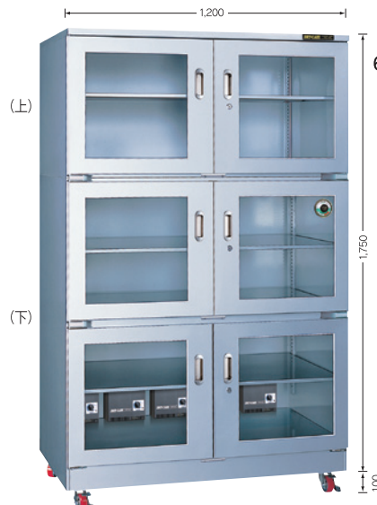
(庫内奥行650mm/外寸奥行730mm)