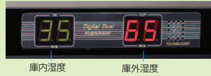
庫内湿度 庫外湿度