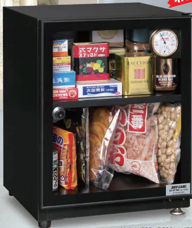
外寸: W360×D390×H475mm (足含) 内寸: W358×D330×H400mm (47ℓ) オープン価格