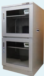
W650×D700×H1200 用于测试研究 上: 3%RH或更低 下: 10-30%RH