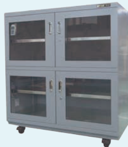
W1200×D710×H1210 用于模具储存 超低湿度型 装载量: 每个货架250公斤