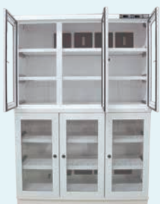
W1220×D538×H1750 用于显示 恒定湿度50%RH 内部LED照明