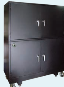
W1500×D650×H1800 对于HDVD的长期存储, 用于承重 电磁波防护涂料