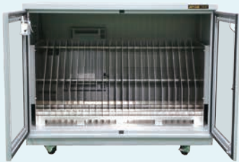
W1200×D760×H1040 卷轴 (φ600 or φ400) 可以存储25 湿度5%RH或更低, 防静电, 耐负荷500kg