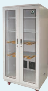
W800×D730×H1680 剑存储 恒湿30%RH