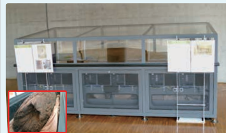
存储物品: 从“唐古·键”遗迹中挖掘出的支柱 长度: 250cm 直径: 83cm 重量: 900kg 这个柱子被用于弥生时代中期建造的建筑中。