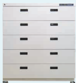
W 1000×D650×H 1350 (包括脚轮) 湿度计与数字控制器 可设置为任何湿度 (仅限除湿) 温度显示: 30~60%RH±5%RH