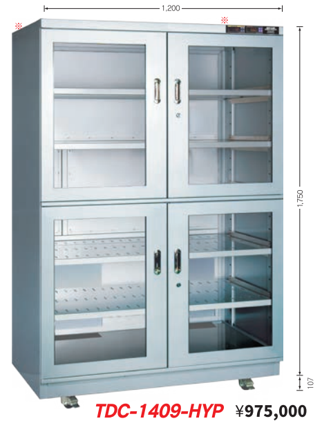
TDC-1409-HYP ¥975,000 TDC-1409-DUS ¥830,000 （庫内奥行 650mm）（税別・送料別途）

仕様（注）製品改良に伴い、予告なく仕様を一部変更することがあります。 ●寸法はW(幅)×D(奥行)×H(高さ)の順で表示しています。