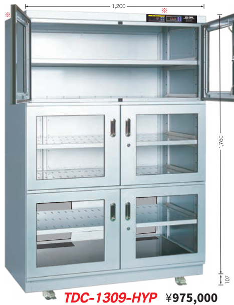
TDC-1309-HYP ¥975,000 TDC-1309-DUS ¥830,000 （庫内奥行 650mm）（税別・送料別途）