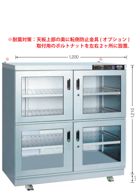
TDC-909-HYP ¥785,000 （庫内奥行 650mm）（税別・送料別途）