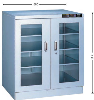
TDC-509-HYP ¥508,000 (庫内奥行650mm/外寸奥行756mm) (税別・送料別途)