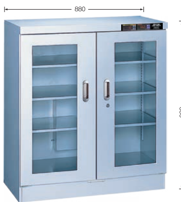
TDC-299-HYP ¥438,000 (庫内奥行390mm) (税別・送料別途)