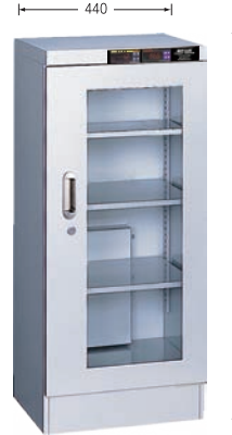
TDC-159-HYP ¥338,000 (庫内奥行390mm) (税別・送料別途)