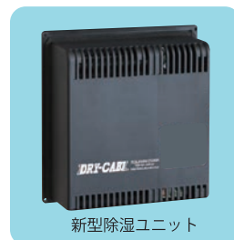
新型除湿ユニット

●湿度計精度: 20~80%RH 時 ±3%RH 0~20、80~100%RH 時 ±3~4.5%RH ■消費電力の MAX○○○W 表示は、起動時の瞬間のみです。