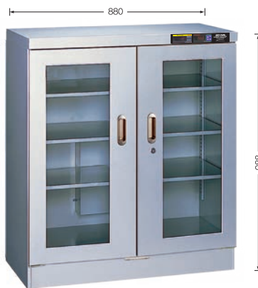
TDC-299-HYP ¥438,000 (庫内奥行390mm) (税別・送料別途)