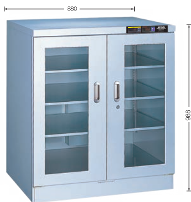
TDC-509-HYP ¥508,000 (庫内奥行650mm/外寸奥行756mm) (税別・送料別途)