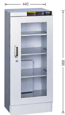
TDC-159-HYP ¥338,000 (庫内奥行390mm) (税別・送料別途)