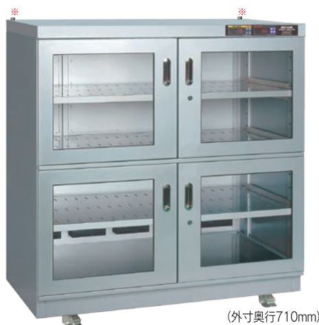
TDC-909-PDX ¥504,000 (庫内奥行650mm) (税別・送料別途)

※耐震対策…天板上部の奥に転倒防止金具（オプション）取付用のボルトナットを左右2ヶ所に設置。