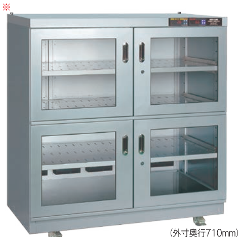
(外寸奥行710mm) TDC-907-PDX ￥480,000 (庫内奥行650mm) (税別・送料別途)

湿度を設定することで定湿度運転（±5%RH）が可能です。湿度を必要以上に下げることの抑えることで消費電力の無駄が抑制できます。