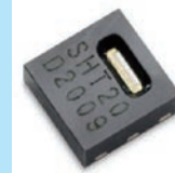
高精度湿度センサー (Sensirion 製)

高精度湿度センサーの採用により針式湿度計では正確に表示することが難しかった 10%RH 前後の湿度を正確に表示できます。 (±3 ~ 4.5%RH*) ※ ±2~3%RH の超高精度湿度センサーに付け替えることも可能です