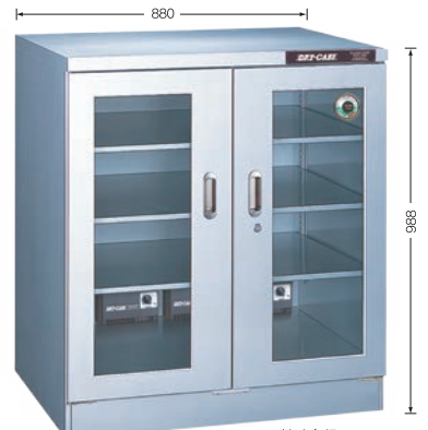
写真は TDC-507-AX (外寸奥行 730mm)

TDC-297-AX ¥168,000 TDC-297-DD ¥178,000 (庫内奥行390mm) (税別・送料別途)