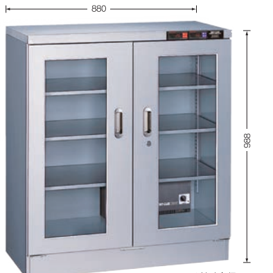
写真は TDC-297-DD (外寸奥行 468mm)

TDC-157-AX ¥99,000 TDC-157-DD ¥109,000 (庫内奥行390mm) (税別・送料別途)