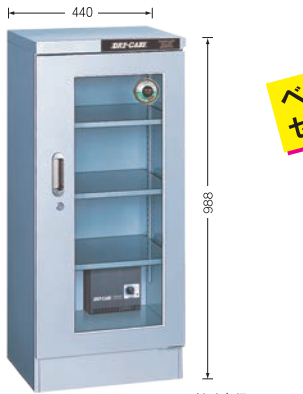
写真は TDC-157-AX (外寸奥行 468mm)

TDC-157-AX ¥99,000 TDC-157-DD ¥109,000 (庫内奥行390mm) (税別・送料別途)