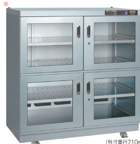
（外寸奥行710mm） TDC-907-PDX ¥480,000 （庫内奥行650mm）（税別・送料別途）

湿度を設定することで定湿度運転（±5%RH）が可能です。湿度を必要以上に下げることを抑えることで消費電力の無駄が抑制できます。