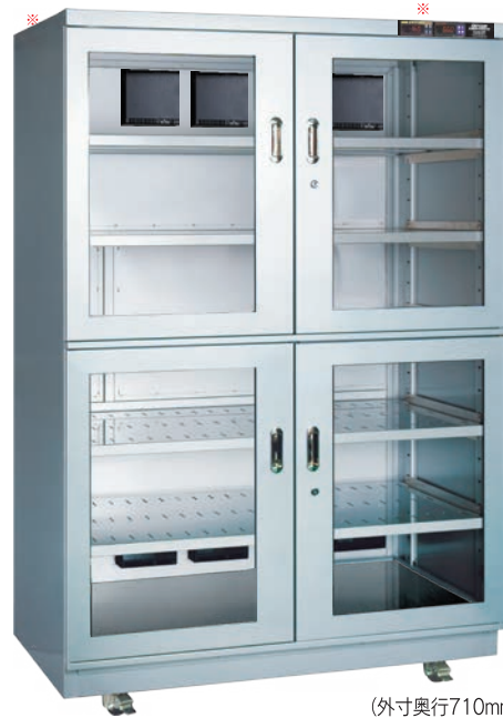
（外寸奥行710mm） TDC-1409-PDX ¥645,000 （庫内奥行650mm）（税別・送料別途）