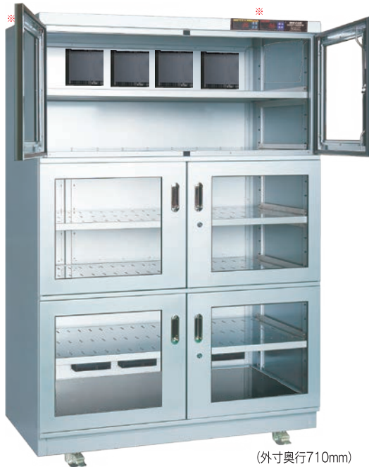
（外寸奥行710mm） TDC-1309-PDX ¥645,000 （庫内奥行650mm）（税別・送料別途）