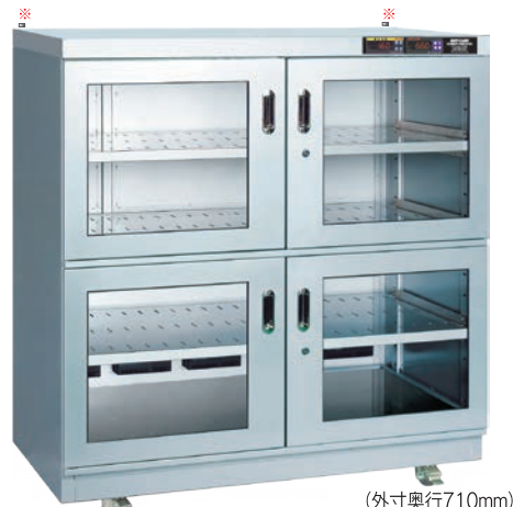
（外寸奥行710mm） TDC-909-PDX ¥504,000 （庫内奥行650mm）（税別・送料別途）

※耐震対策・天板上部の奥に転倒防止金具（オプション）取付用のボルトナットを左右2ヶ所に設置。