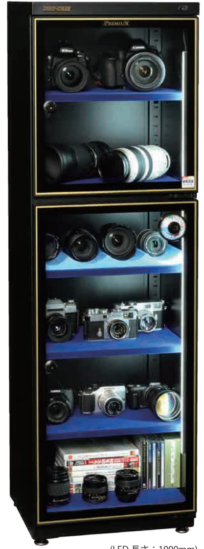
(LED 長さ: 1000mm)