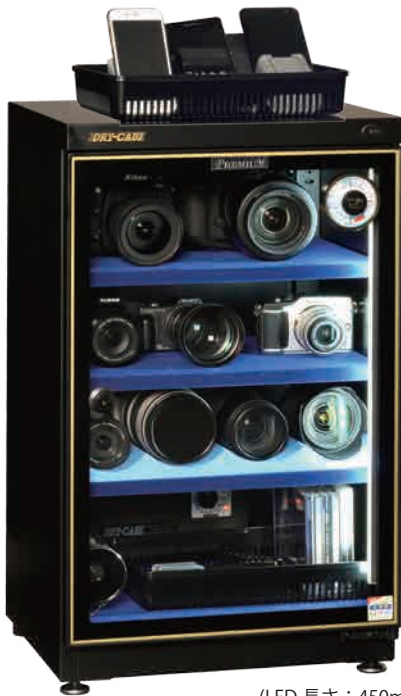
(LED 長さ: 450mm)