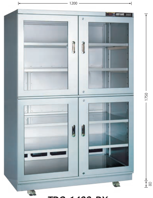
TDC-1400-DX (外寸奥行705mm) (庫内奥行650mm)