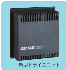
新型ドライユニット