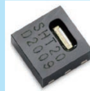
高精度湿度センサー (Sensirion 製)

高精度湿度センサーの採用により針式湿度計では正確に表示することが難しかった 10%RH 前後の湿度を正確に表示できます。 (±3 ~ 4.5%RH*) ※±2 ~ 3%RH の超高精度湿度センサーに付け替えることも可能です