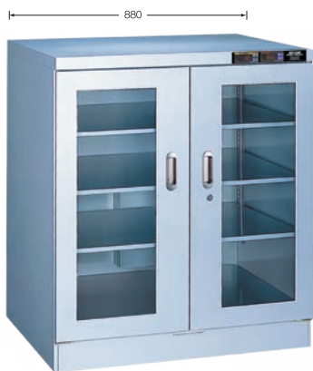
TDC-512-HYP (庫内奥行650mm/外寸奥行756mm)

湿度センサー（湿度トランスミッター）の校正証明書（トレーサビリティ証明書付き）の発行が可能になりました。詳細は 8P をご覧ください。