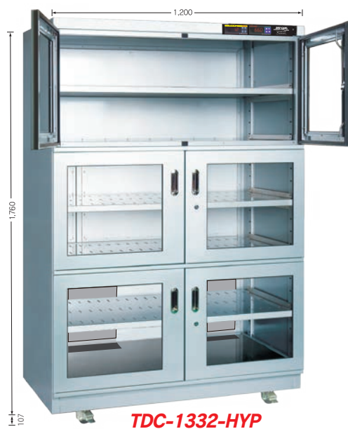
TDC-1332-HYP TDC-1332-DUS (庫内奥行 650mm)