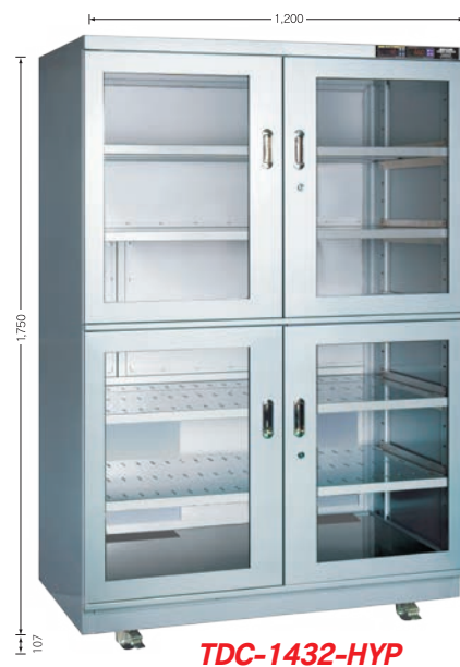
TDC-1432-HYP TDC-1432-DUS (庫内奥行 650mm)