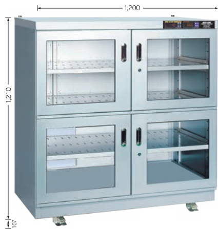
受注生産 TDC-932-HYP (庫内奥行 650mm)

※耐震対策：天板上部の奥に転倒防止金具（オプション）取付用のボルトナットを左右2ヶ所に設置。