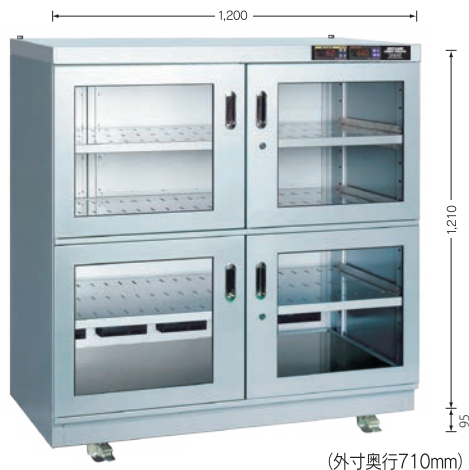
受注生産 TDC-932-PDX (庫内奥行650mm)

湿度を設定することで定湿度運転（±5%RH）が可能です。 湿度を必要以上に下げることが抑えることで消費電力の無駄が抑制できます。