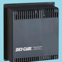
新型除湿ユニット