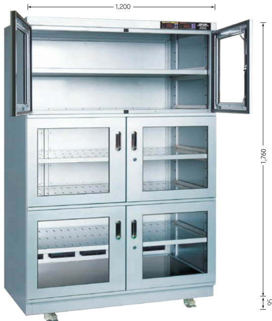
TDC-1332-DD （外寸奥行710mm） （庫内奥行650mm）

中央支柱がありません。（両開きタイプ全機種） 横長のものも楽に出し入れできます。