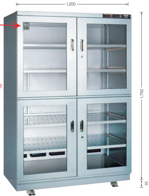
TDC-1432-DD （外寸奥行710mm） （庫内奥行650mm）

オプション取付例 デジタル湿度計 ・湿度（温度）表示 ・ロギング機能付 P19 オプション参照