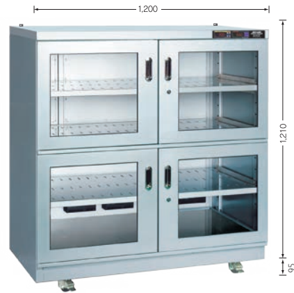
受注生産 TDC-932-DD （外寸奥行710mm） （庫内奥行650mm）

中央支柱がありません。（両開きタイプ全機種） 横長のものも楽に出し入れできます。