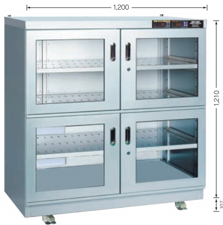
受注生産 TDC-932-HYP (庫内奥行 650mm)

※耐震対策：天板上部の奥に転倒防止金具（オプション）取付用のボルトナットを左右2ヶ所に設置。