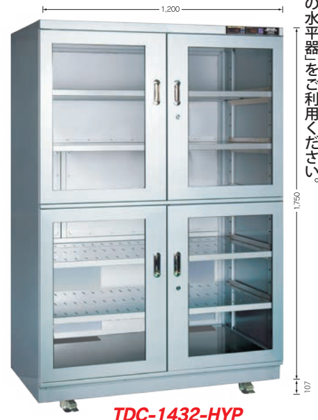
TDC-1432-HYP TDC-1432-DUS (庫内奥行 650mm)