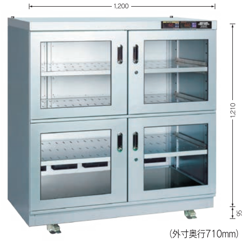
受注生産 TDC-932-PDX (庫内奥行650mm)