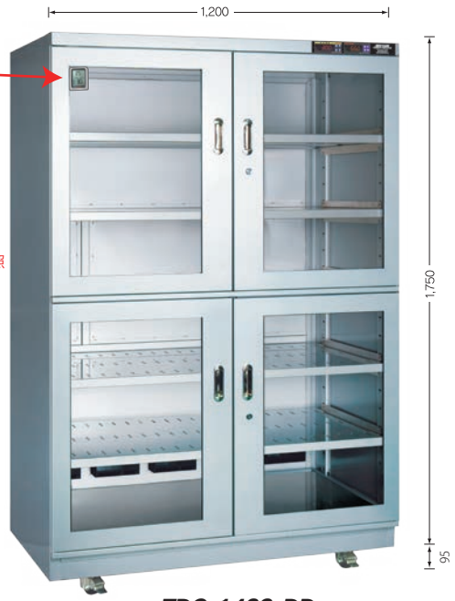
TDC-1432-DD (外寸奥行710mm) TDC-1432-AX (外寸奥行730mm) (庫内奥行650mm)

オプション取付例 デジタル湿度計 ・湿度(温度)表示 ・ロギング機能付 P19 オプション参照