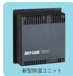
新型除湿ユニット