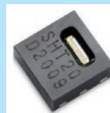
高精度湿度センサー (Sensirion 製)

湿度設定は 0.1%RH 単位で可能 湿度表示範囲 0.0 ~ 99.9%RH 湿度設定範囲 1.0 ~ 99.9%RH