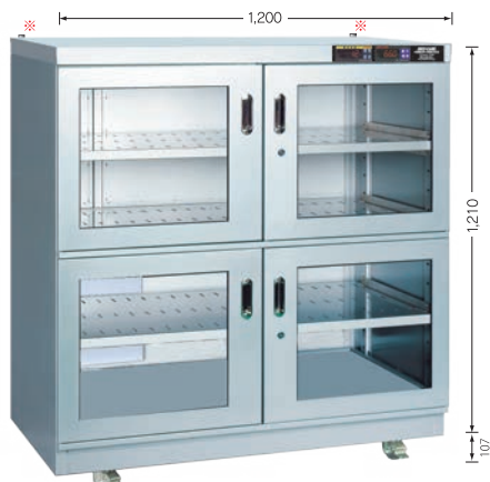
TDC-909-HYP (庫内奥行 650mm)

※耐震対策：天板上部の奥に転倒防止金具（オプション）取付用のボルトナットを左右2ヶ所に設置。