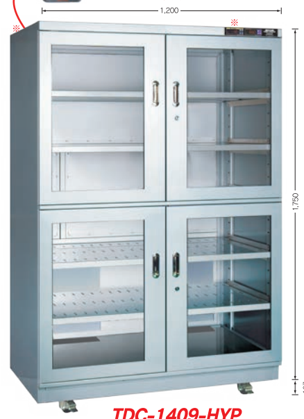
TDC-1409-HYP TDC-1409-DUS (庫内奥行 650mm)