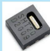
高精度湿度センサー (Sensirion 製)

湿度設定は 0.1%RH 単位で可能 湿度表示範囲 0.0 ~ 99.9%RH 湿度設定範囲 1.0 ~ 99.9%RH