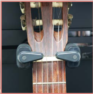
自動ロックハンガー