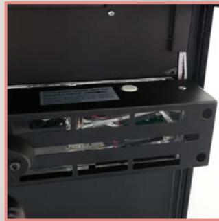
超音波方式加湿器