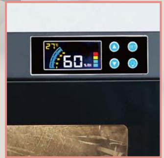
デジタル湿度コントローラ

ギター保管の最適湿度は 50%RH 前後といわれています。詳細は楽器店にご確認ください。