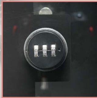
ダイヤル式ロック