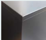
粉体焼付塗装を施したスチール表面

エターナルシリーズではドライキャビ伝統の青いクッションシート付棚板を採用。カメラが滑らない・傷つかない究極の棚板です。クッションシート付棚板は、世界でドライ・キャビだけのオリジナルアイテムです。また、固定式棚板は端から端まで広く使えて引き出し式より収納量が多くなる利点があります。スチール表面は、耐久性があり環境にも優しい粉体焼付塗装を施しています。