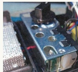
機械式湿度スイッチ

防湿庫の心臓部である除湿ユニットは長寿命で定評のある乾燥剤方式。湿度制御には故障しにくい機械式湿度スイッチを使用。万が一故障してもユニットの修理が可能（ユニットの着脱は簡単）。