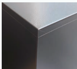
粉体焼付塗装を施したスチール表面

カメラを永く大事にしたいという想いにこたえて、エターナルシリーズではドライ・キャビ伝統の青いクッションシート付棚板を採用。カメラが滑らない・傷つかない究極の棚板です。クッションシート付棚板は、世界でドライ・キャビだけのオリジナルアイテムです。固定方式は、棚板を広く使用できる半固定方式。棚板を引き出すことはできませんが、フックのかけ替えにより棚板の位置を上下に動かすことが可能です。また、スチール表面は、耐久性があって環境にも優しい粉体焼付塗装を施しています。