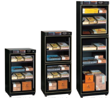
シガー用ヒューミドール 湿度:50%RH~75%RH