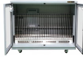
リール保管庫 湿度 3%RH以下 各リールサイズ対応可能