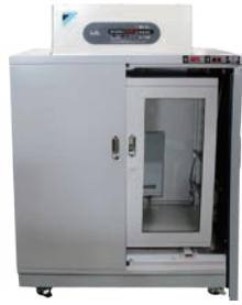
冷却型:湿度 3%RH以下 温度 15~20℃