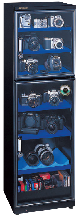
※キャビネット内はイメージです。実際は写真とは異なります。